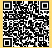
Download Google Play Store